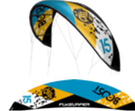
Boost LW 15 m 2