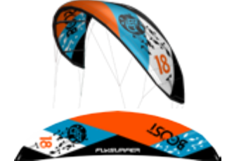
Boost LW 18 m 2