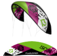
Boost 13 m 2