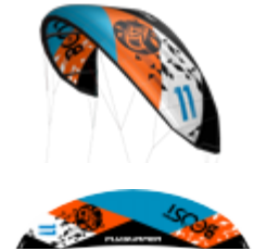
Boost 11 m 2