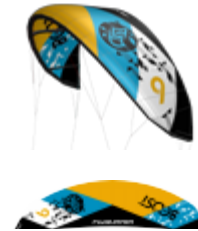
Boost 9 m 2