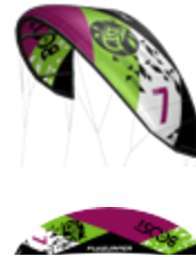
Boost 7 m 2